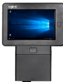
Station murale scanning