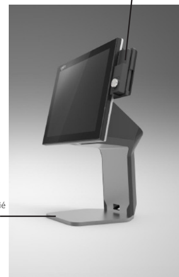
Espace libre dédié imprimante / scanner